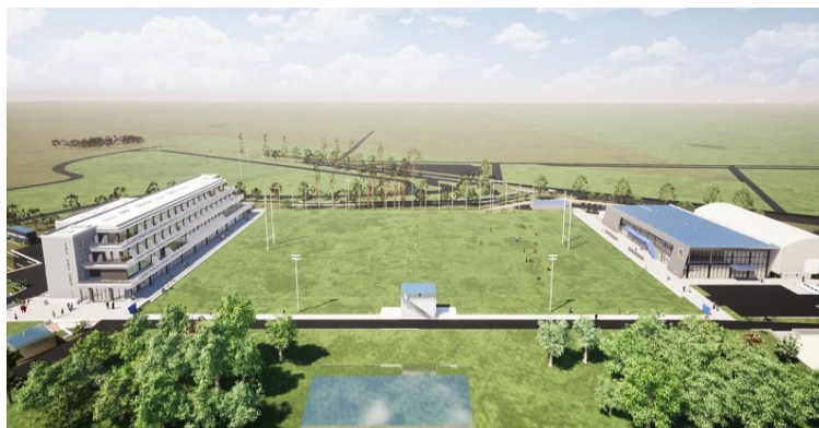
施設の完成予想図（左：合宿所棟・宿泊施設他、右：管理棟・クラブハウス他）

これは、2021年8月、同チームの本拠地を群馬県太田市から埼玉県熊谷市へ移転することに伴い、チーム施設と付帯施設を整備するもので、自治体が管理する都市公園内における民間施設となります。ラグビートップチームのクラブハウスと宿泊棟を一体整備するこの施設は、隣接する熊谷ラグビー場（2019年ラグビーW杯開催地）も含めて日本では例のない規模となり、世界に誇れるラグビータウンが完成することになります。