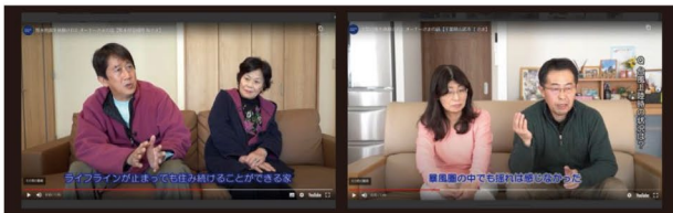
04 熊本地震、千葉台風で被災された オーナー様の声&リモートトーク