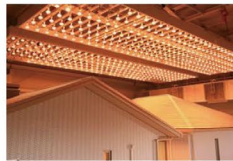
02 住宅試験 センター見学