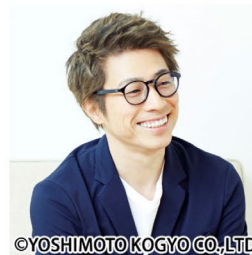
田村 淳さん (ロンドンブーツ1号2号)