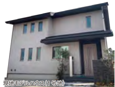
現地モデルハウス(1号地)