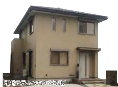
現地モデルハウス(3号地)