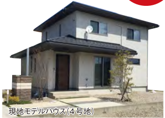
現地モデルハウス(4号地)