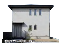
現地モデルハウス(4号地)