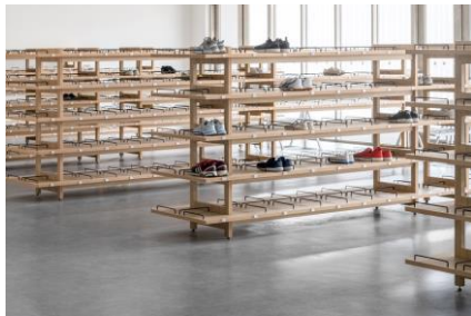
下足棚:壁をつくらず目線が通る明るいづくり (造作家具)