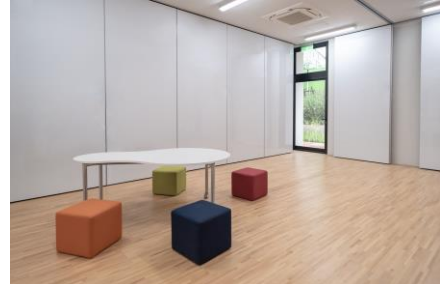
オープンスペース:学習内容に合わせて、廊下も学習スペースとして活用(既製家具)