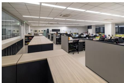
職員室:児童生徒が入れるエリアを視認させる棚(既製家具)