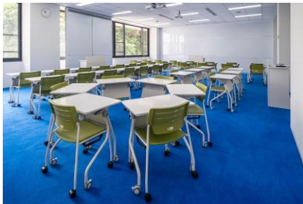
アクティブラーニング:学習方法に合わせて可動式家具(既製家具)