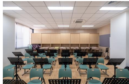
音楽室:壁面スペースを有効活用する収納棚(造作家具)