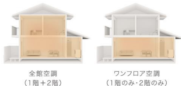
※オリジナル全館空調「スマート・エアーズ」を常時運転している場合のイメージ図です。

1～2階の全館空調はもちろん、1階だけ、もしくは2階だけのワンフロア空調にも対応。例えば、子供が独立して主な生活エリアが1階だけになった場合など、家族構成やライフスタイルに合わせた空調ができます。