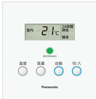
「エコナビ」コントローラー

さらに、建物内外の温度差を感知して自動で省エネ運転する「エコナビ ※4 」機能を搭載。換気にかかる動力負荷を抑えています。また、地熱の効果で外気と比べて夏は涼しく、冬は暖かいベース空間(床下)の空気を給気することで、冷暖房効率をアップさせ、省エネ性を高めています。また、住まいの断熱リフォームを併せて行うことでさらに効率アップも期待できます。