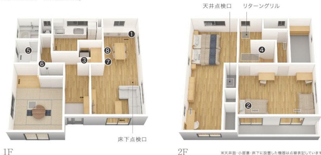
【全館空調リフォーム機器配置例】

全館空調「スマート・エアーズ」は、室内機を、1階は階段下等に、2階は小屋裏(屋根裏)へ設置します。また、空調の吹き出し口は、1階は床面に、2階は天井面に設けて空気を循環させます。いずれの配置も、リフォームにおける間取り設計への影響をできるだけ抑えながら、快適な空気環境が実現できます。