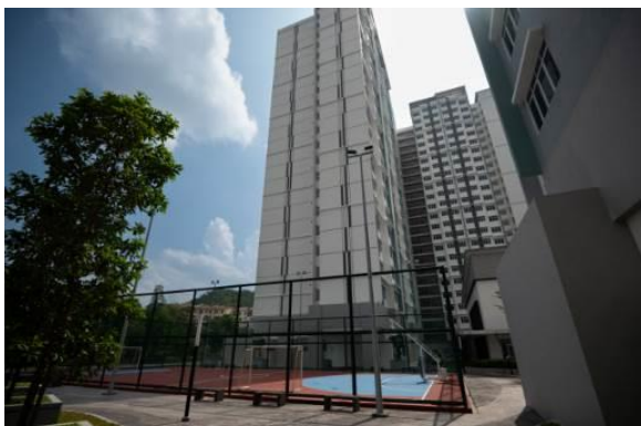
共有スペース(バスケットコート)