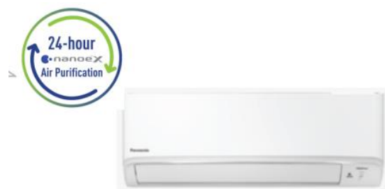
採用予定のパナソニック空調システム