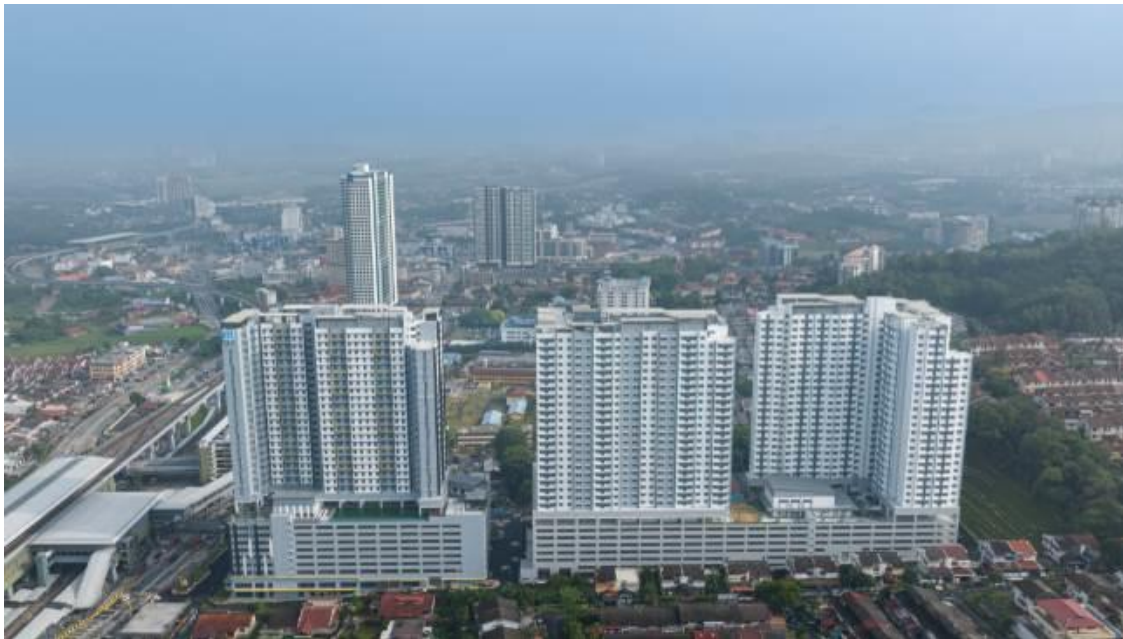
建築請負を担当した分譲マンション『NEXUS』全景 空撮

当社は、2012年にマレーシアでの住宅事業を開始して以来、戸建住宅（全1,444戸）の建築請負を中心に住宅供給を進めてきました。また、当社初となるSENTUL（セントウル）のマンション（500戸）の建築請負以降、1,000戸超のマンション2棟を次々と竣工することで、マレーシアにおける戸建住宅・マンションの供給総戸数は約5,000戸に達する見込みです。