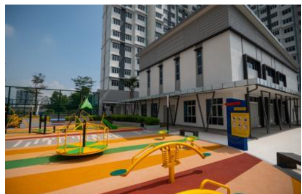
共有スペース(公園)