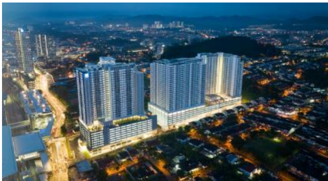
NEXUS マンション夜景(空撮)

事業地は、首都であるクアラルンプール中心地から南東約 20 kmに位置する Kajang(カジャン)地区に位置し、現地公共交通 MRT 線および KTM 線の Kajang 駅に隣接しています。車社会であるマレーシアにおいて、公共交通機関の利用を前提に組み立てられた沿線開発 TOD (Transit Oriented Development) 型プロジェクトとして、同国における交通渋滞の解消や効率的な経済発展の促進が期待されています。