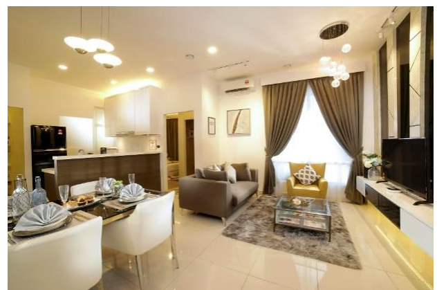
室内イメージ(モデルルーム画像)