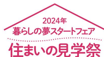
『住まいの見学祭』ロゴ

なお、各会場では、住まいづくりの質問や、土地探しや資金計画等に関する個別相談にもお応えします。このほか、一部の街かどモデルハウスでは、いい空気が体感できる会場もご用意しています。