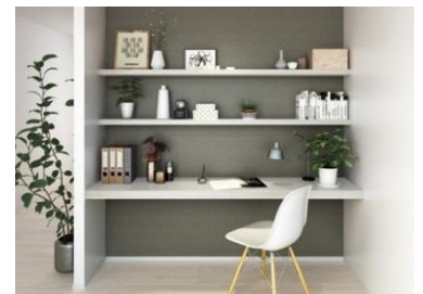
子ども見守りカウンター

また、アンケート ※2 の結果から、「シンクやキッチン作業スペースが小さく、作業がはかどらない」「衣替えが面倒」など、家事環境が非効率であるため時間がなくなり、家事が十分にできていないことが罪悪感・ストレスにつながっていることもわかりました。当社で培った「家事楽」 ※1 のノウハウを賃貸版にカスタマイズし、毎日の家事の困りごとに着目して家事空間の快適性を高めることで、家事の負荷を軽減し、時間と心にゆとりを生み出します。