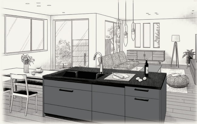
リビング・ダイニング・キッチンイメージイラスト