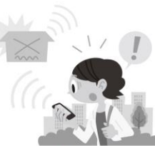
インターネット/セキュリティ

選ばれる賃貸住宅の設備・仕様は時代ごとに変化します。情報通信の発展とともに、これからはより高度なセキュリティシステムやIoTを活かした豊かで便利な住まいが賃貸住宅にも求められます。そのあり方についてNTT東日本より専門家を招いて、解説します。ニーズの先取りで今後の賃貸住宅経営にお役立てください。