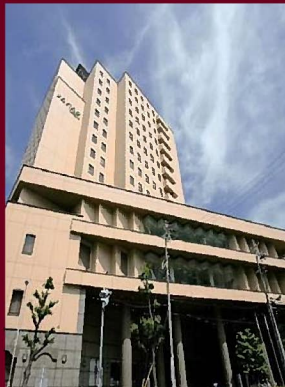
ホテルメルパルク名古屋

お申込方法 1 下記へのお電話で 【お申込み締切】 2 お申込みフォームにて 2019年1月10日(木) ※締切前でも定員に達し次第、受付を終了いたします。 お早目にお申込みください。