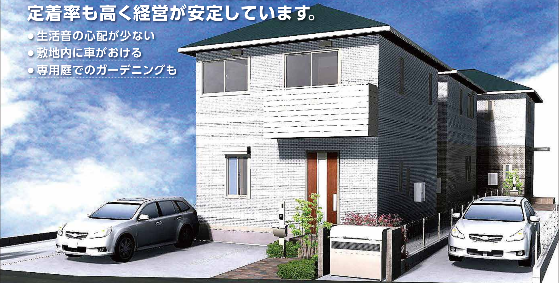
完成イメージパース