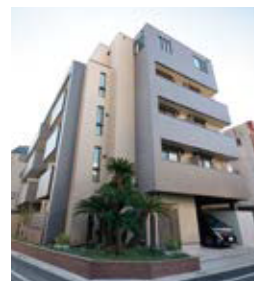
5階建／賃貸併用住宅