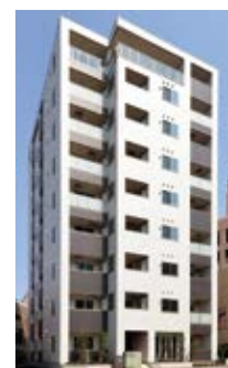
9階建／賃貸マンション