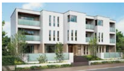
3階建／賃貸専用住宅