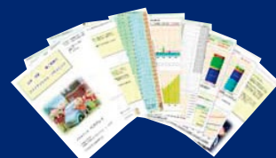
ご家族だけの「ライフプラン表」

自分たちには一体いくらマイホームなら無理なく買えるのか？ 生涯収支と貯蓄残高の推移をシミュレーションすれば家づくり 可能予算が分かります。作成したシミュレーションはその場でお 渡しいたします。