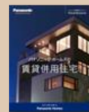
⑥賃貸併用住宅カタログ