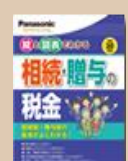
⑫相続・贈与の税金