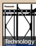
②技術紹介「テクノロジーブック」