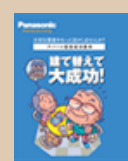
⑩建て替えで大成功！