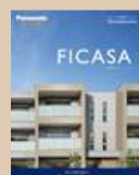
④賃貸住宅「フィカーサ」