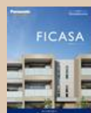
④賃貸住宅「フィカーサ」