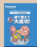
⑩建て替えで大成功！