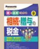
⑫相続・贈与の税金