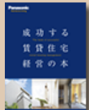
⑦成功する賃貸住宅経営の本