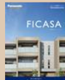
④賃貸住宅「フィカーサ」