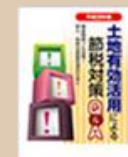
⑪土地有効活用による節税対策Q&A