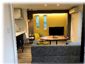
★ 解放感あるリビング

「帰宅してから時間を有効に使いたい」「在宅時間が短いので利便性を高めたい」そんな現代の入居者の声にお応えするため、私たちは先進のIoT技術を生かし、一歩先の豊かな暮らしを実現する「スマート・グラン」をご提案します。 ※いつでもご案内できます。お気軽にお申し付け下さい。