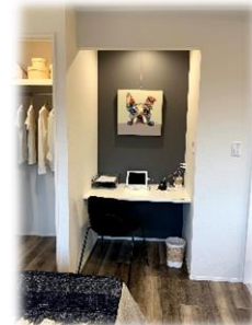
★ デスクワークスペース