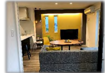
★ 解放感あるリビング

「帰宅してから時間を有効に使いたい」「在宅時間が短いので利便性を高めたい」そんな現代の入居者の声にお応えするため、私たちは先進のIoT技術を生かし、一歩先の豊かな暮らしを実現する「スマート・グラン」をご提案します。※いつでもご案内できます。お気軽にお申し付け下さい。