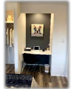
★ デスクワークスペース