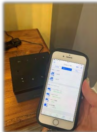
★ IoT仕様 (照明・エアコン・ガス給湯器)