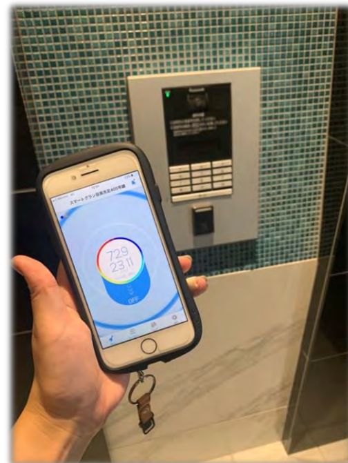
★ IoTオートロック (アプリで施錠)