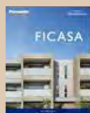
④賃貸住宅 「フィカーサ」