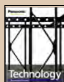
②技術紹介 「テクノロジーブック」