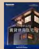
⑥賃貸併用 住宅カタログ