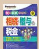
⑫相続・贈与の税金