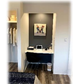
★ デスクワークスペース