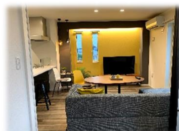
★ 解放感あるリビング

「帰宅してから時間を有効に使いたい」「在宅時間が短いので利便性を高めたい」そんな現代の入居者の声にお応えするため、私たちは先進のIoT技術を生かし、一歩先の豊かな暮らしを実現する「スマート・グラン」をご提案します。 ※いつでもご案内できます。お気軽にお申し付け下さい。