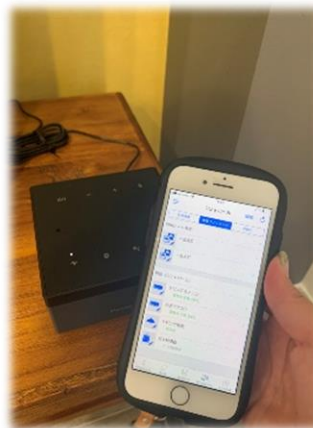
★ IoT仕様 (照明・エアコン・ガス給湯器)