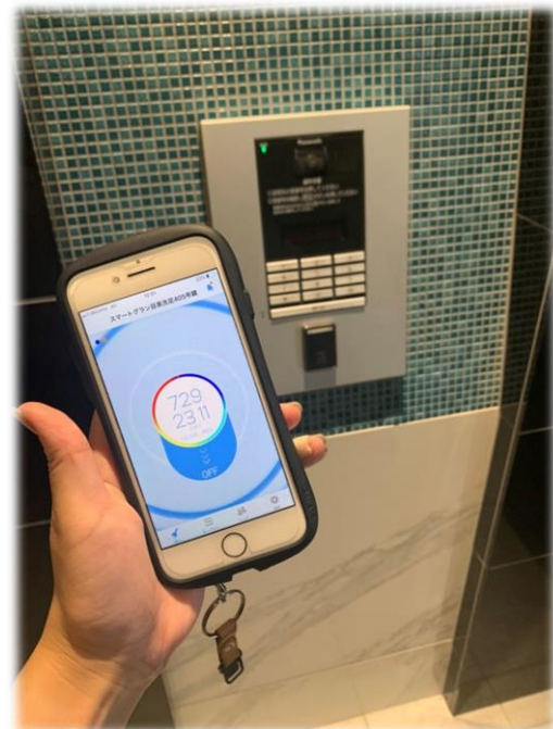
★ IoTオートロック (アプリで施錠)