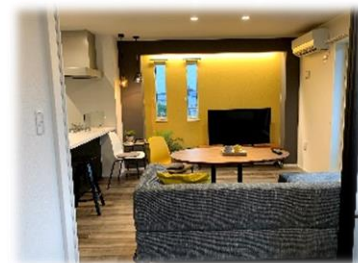
★ 解放感あるリビング

「帰宅してから時間を有効に使いたい」「在宅時間が短いので利便性を高めたい」そんな現代の入居者の声にお応えするため、私たちは先進のIoT技術を生かし、一歩先の豊かな暮らしを実現する「スマート・グラン」をご提案します。 ※いつでもご案内できます。お気軽にお申し付け下さい。