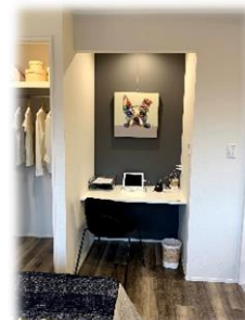
★ デスクワークスペース