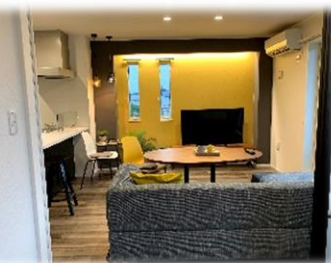
★ 解放感あるリビング

「帰宅してから時間を有効に使いたい」「在宅時間が短いので利便性を高めたい」そんな現代の入居者の声にお応えするため、私たちは先進のIoT技術を生かし、一歩先の豊かな暮らしを実現する「スマート・グラン」をご提案します。 ※いつでもご案内できます。お気軽にお申し付け下さい。