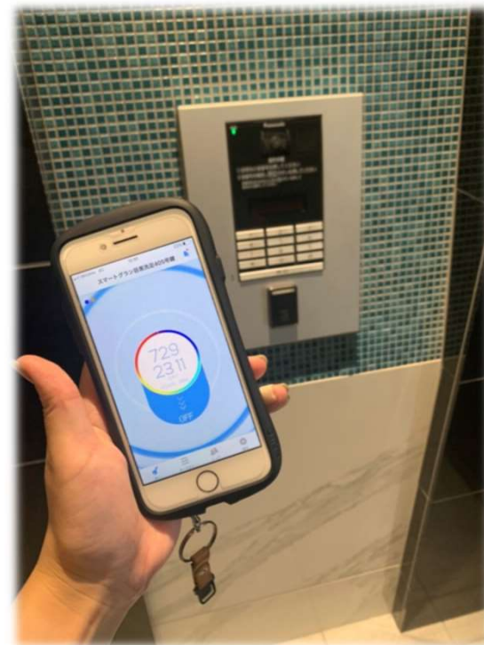
✧ IoTオートロック (アプリで施錠)