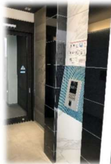
★ IoTオートロック (アプリで施錠)