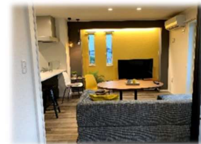
★ 解放感あるリビング

「帰宅してから時間を有効に使いたい」「在宅時間が短いので利便性を高めたい」そんな現代の入居者の声にお応えするため、 私たちはIoT技術を生かし、豊かな暮らしを実現する「スマート・グラン」をご提案します。