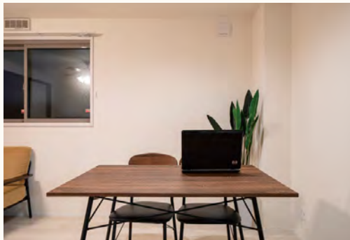
※現地モデルルーム