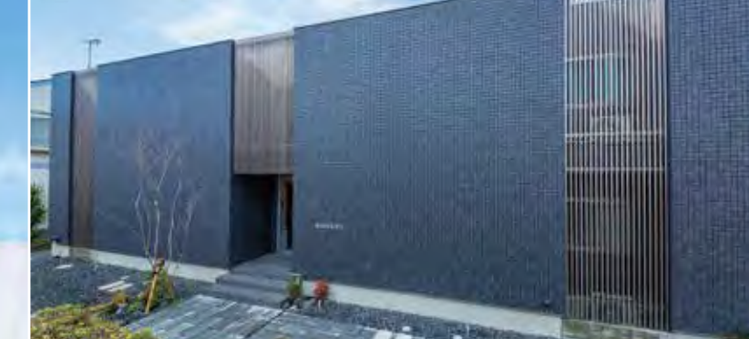
デザインも間取りもしっかりと差別化した スタイリッシュな3階建賃貸