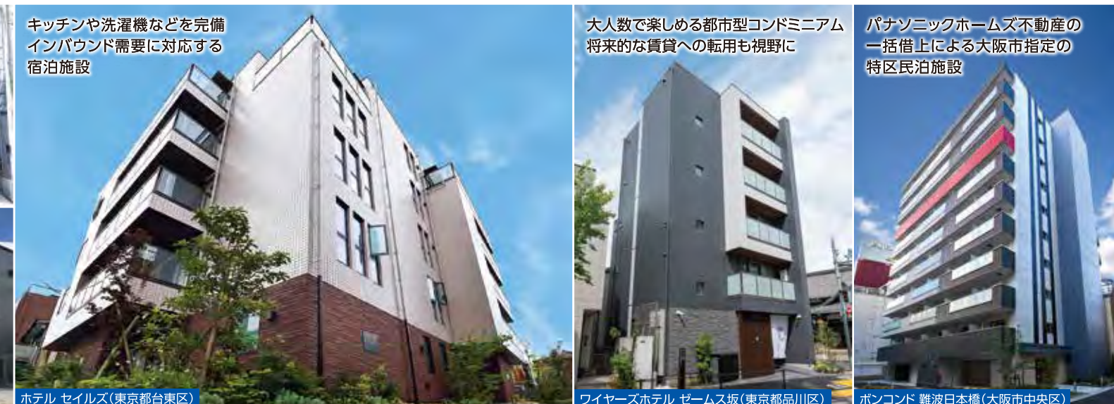
キッチンや洗濯機などを完備 インバウンド需要に対応する 宿泊施設

日本のポテンシャルを考えると、さらなるインバウンド市場の拡大が予想されます。 その中で求められているのが、質の高い宿泊施設。 さらに、民泊新法など法整備も進んでおり、従来に比べて新規参入がしやすくなりました。