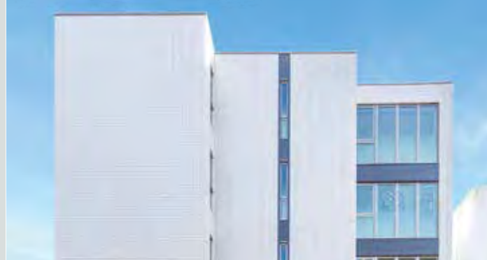
ピアネロ(愛知県名古屋市) / 賃貸(4戸)