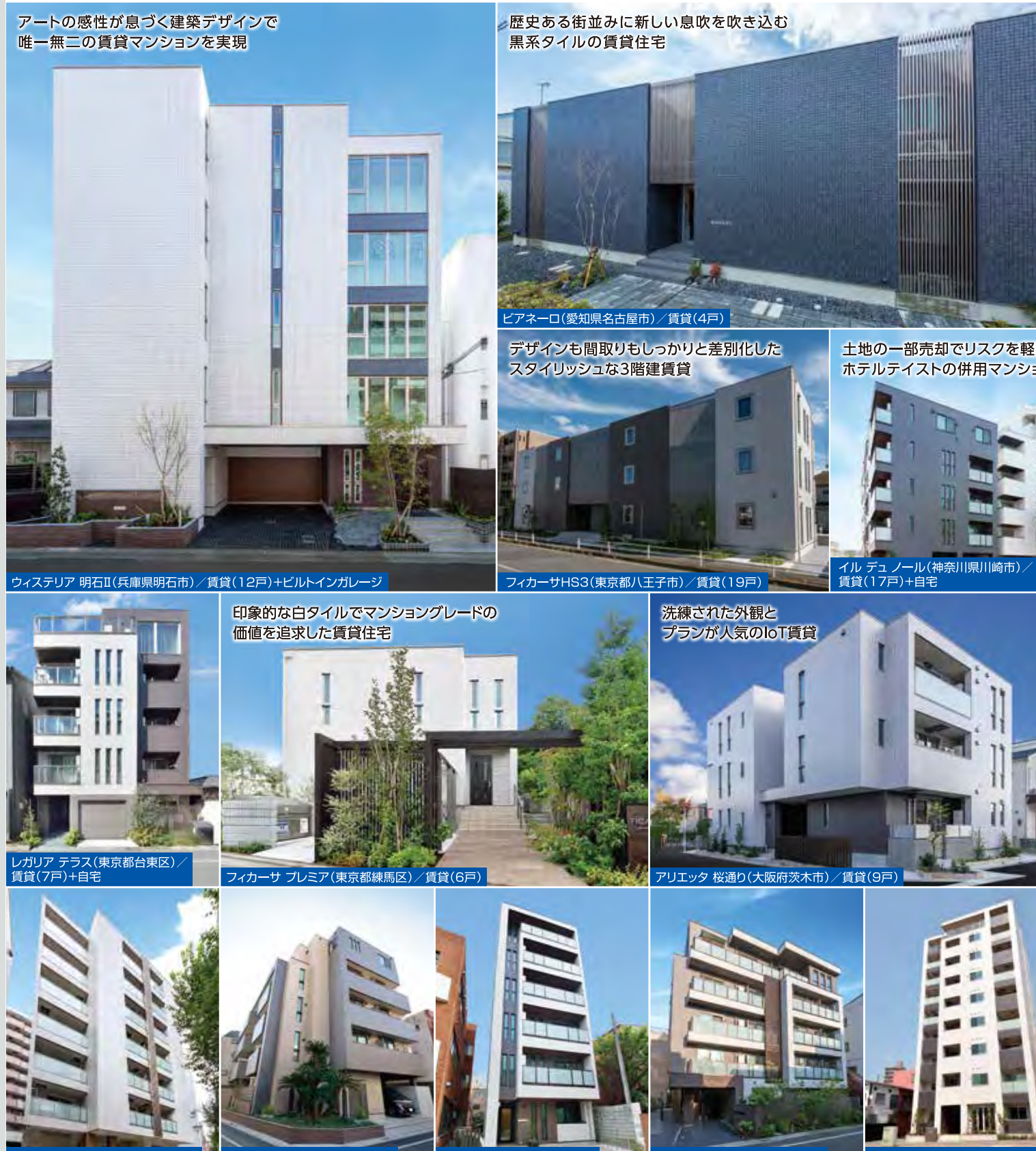
アートの感性が息づく建築デザインで 唯一無二の賃貸マンションを実現

美しさが長持ちする外観と、優れた設計提案力で将来にわたる収益力を高め、技術を生かした暮らし提案で、入居者のニーズと安心・快適な暮らしに応え続けます。賃貸管理や経営をトータルサポートしながら、オーナーさまに安定した収益と、入居者に暮らす喜びをもたらします。