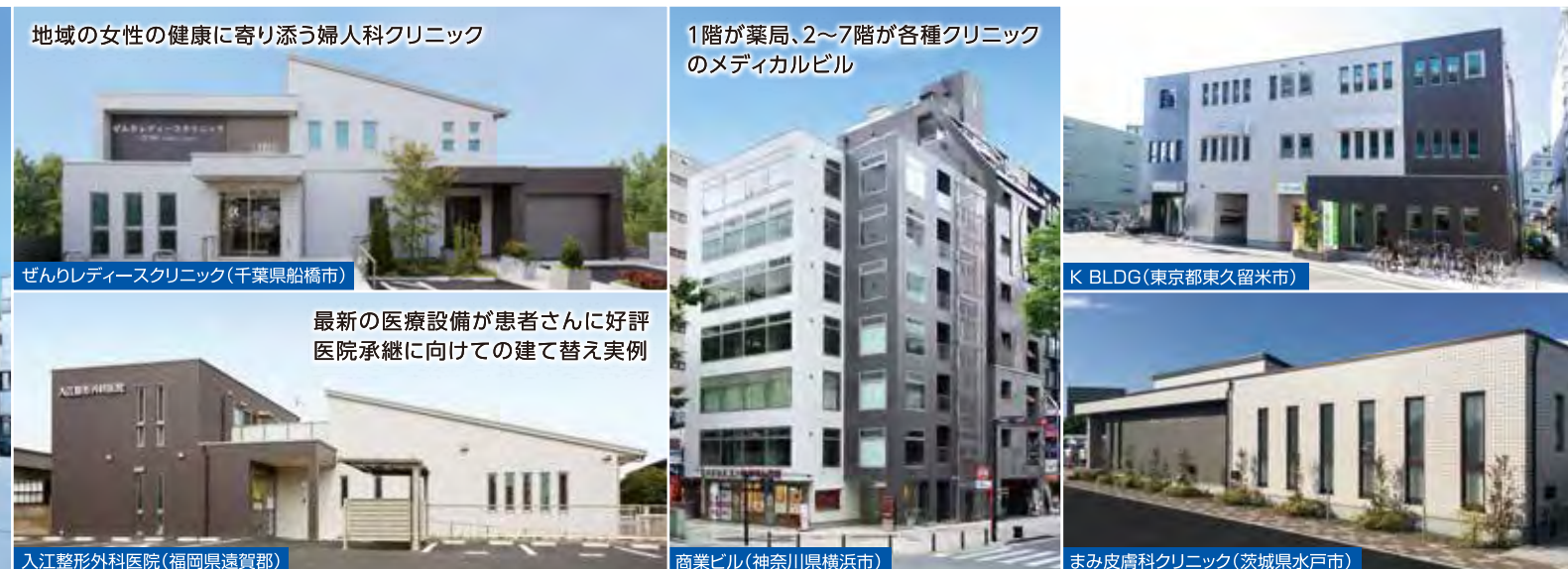
地域の女性の健康に寄り添う婦人科クリニック

地域で勝ち残るには、いかに選ばれるクリニックを実現するかが大切です。 そのためには親しみやすい外観、明るく開放感のある診療空間など、安心・快適への配慮も必要不可欠。 20年を超える経験と実績で、地域のニーズに応え、魅力あるクリニックづくりをお手伝いいたします。