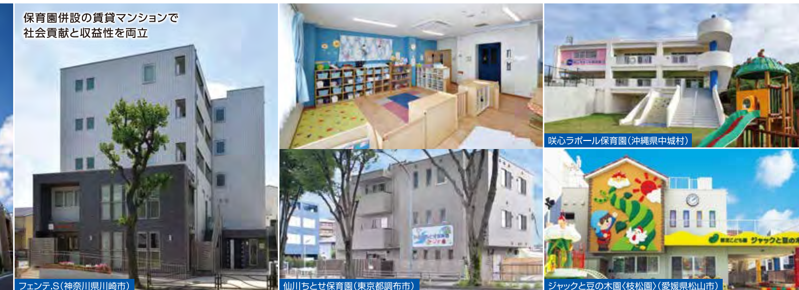
保育園併設の賃貸マンションで 社会貢献と収益性を両立

子どもの遊びや学びに適した環境、事故防止や健康面まで考慮した設計が可能。 施設分類に関するご提案や助成金の情報提供を行うなど、 土地活用の枠を超えて保育施設づくりをサポートします。