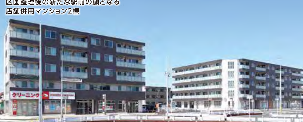
エム ノーブル エム グランツ(千葉県千葉市) / 賃貸(65戸)+店舗 / 2棟