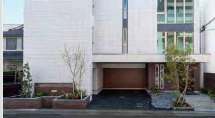
ウイステリア 明石II(兵庫県明石市) / 賃貸(12戸)+ビルトインガレージ