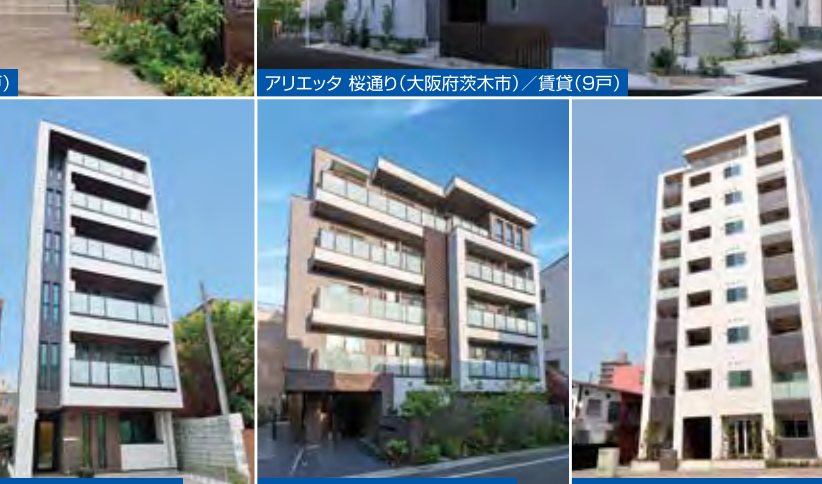
ビューノNS5(東京都江東区) / 賃貸(13戸)+自宅