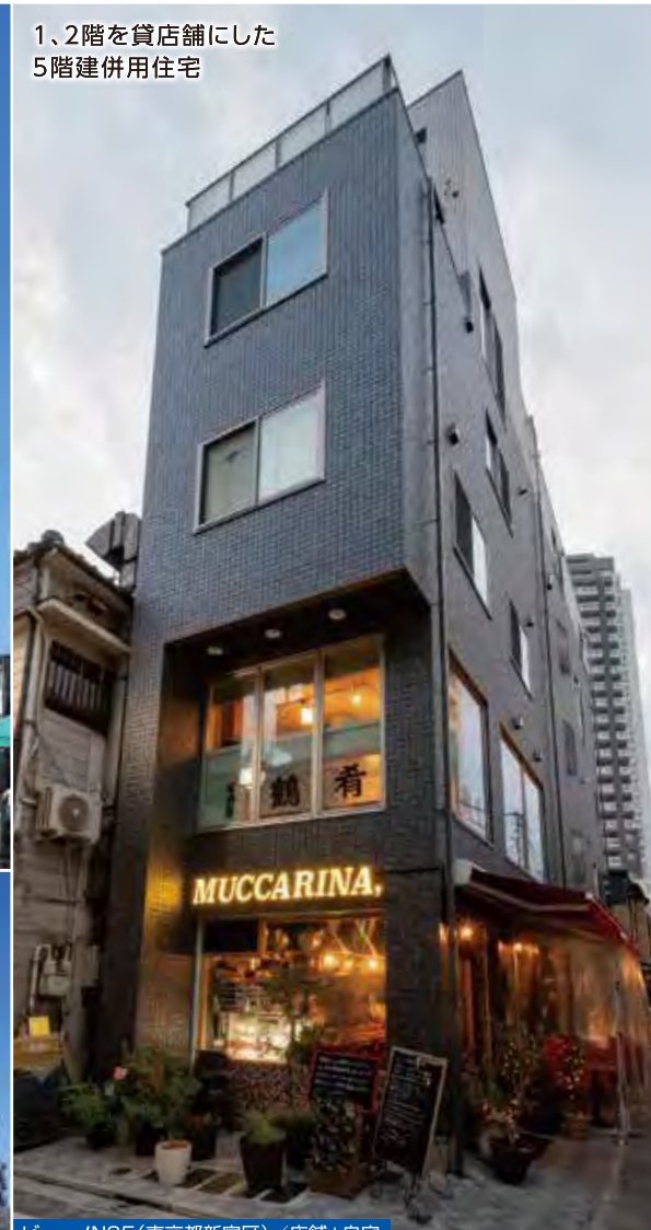
1、2階を貸店舗にした 5階建併用住宅