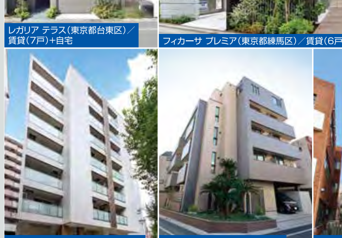
メゾン プランシュ(兵庫県神戸市) / 賃貸(17戸)+自宅