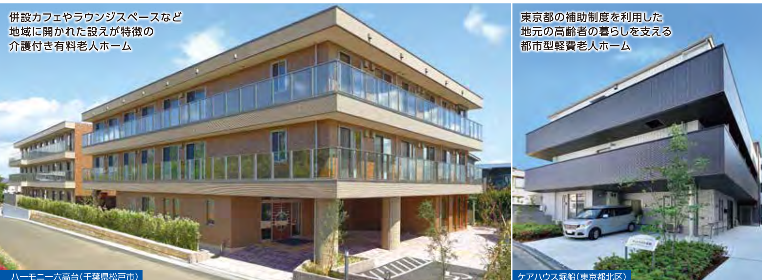
併設カフェやラウンジスペースなど 地域に開かれた設えが特徴の 介護付き有料老人ホーム

豊かな高齢化社会を考えて地域社会に貢献したいと考えるオーナーさまを応援します。 それが要介護の方を対象にした高齢者住宅です。さらに、入居者ニーズに応えるための「ケア付き高齢者住宅」をはじめ、幅広い高齢者事業建築を展開しています。