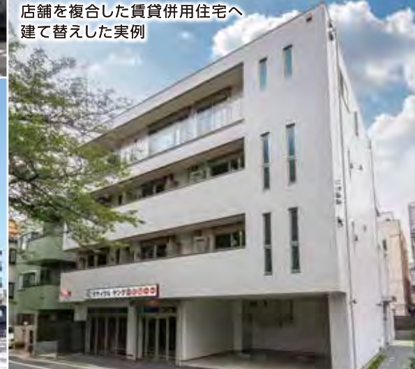
renew.kyodo(東京都世田谷区) / 13戸(店舗・オーナー宅含)