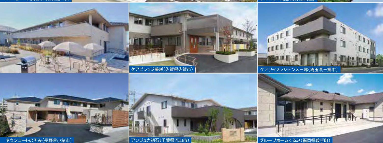
タウンコートのおぞみ(長野県小諸市)