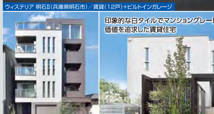
印象的な白タイルでマンションブレードの 価値を追求した賃貸住宅