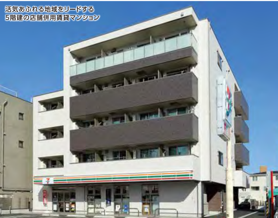
Clair荒町(宮城県仙台市) / 賃貸(28戸)+1F店舗(コンビニ)

上へ上へとフロアを重ねる多層階住宅の発想で、土地を、守り、育て、活かすご提案をいたします。