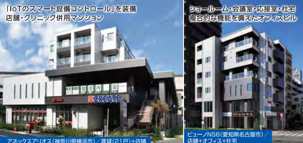
IoTのスマート設備コントロールを装備 店舗・クリニック併用マンション