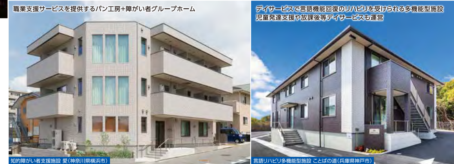
職業支援サービスを提供するパン工房+障がい者グループホーム

2000年の介護保険制度導入に先駆け、介護・医療・福祉施設に取り組んでまいりました。 パナソニック ホームズは、培ってきたノウハウと、「ケアリンクシステム」など充実のサポートで、 一人ひとりに寄り添いながら暮らしを支える、障がい者福祉施設をご提案いたします。