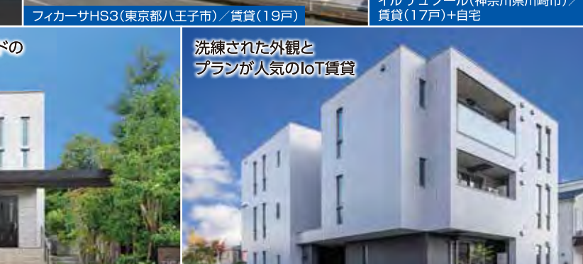
洗練された外観と プランが人気のIoT賃貸