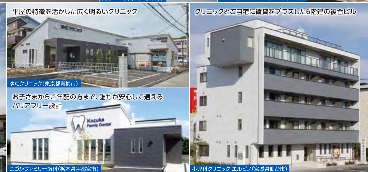
平野の特徴を活かした広く明るいクリニック