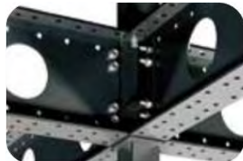
建物と入居者を守り抜く 頑強な構造体