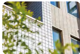
耐久性の高いタイル外壁