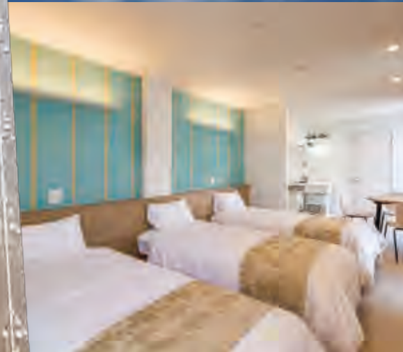
民泊施設 宿泊室のインテリア

※訪日外客数とは、日本を訪れた外国人旅行者の数であり観光の他、ビジネスでの訪問者、留学生などが含まれます。 ※インバウンドとは、訪日外国人旅行を意味します。