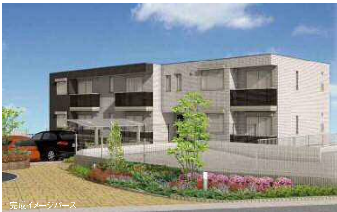
完成イメージパース