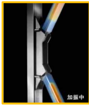
アタックフレーム