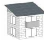
キラテックタイル 200㎡