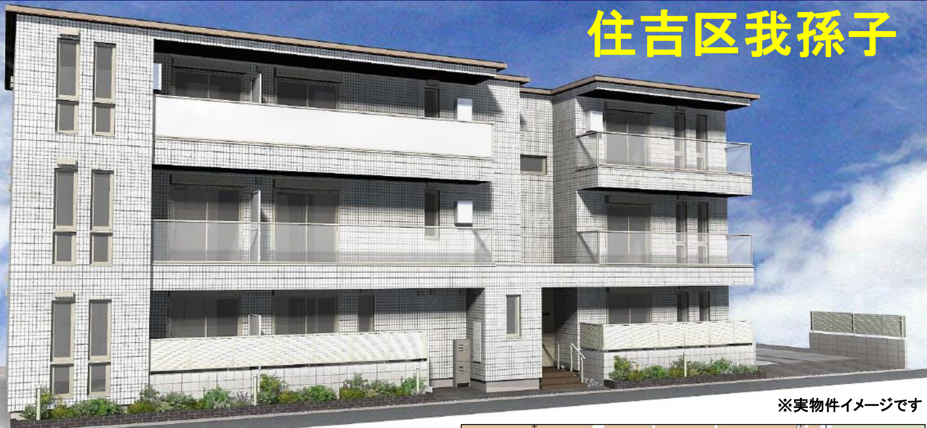
※実物件イメージです