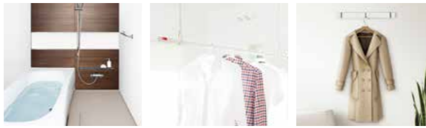
リラックスバスルーム 室内物干しエアフープ ブラインドフック