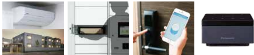
スマート設備コントロール スマート宅配システム スマートキーシステム スマートスピーカー