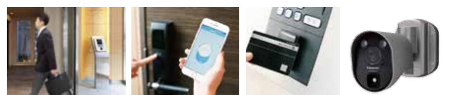
スマートチェックインシステム スマートキーシステム カードキーシステム 防犯カメラ