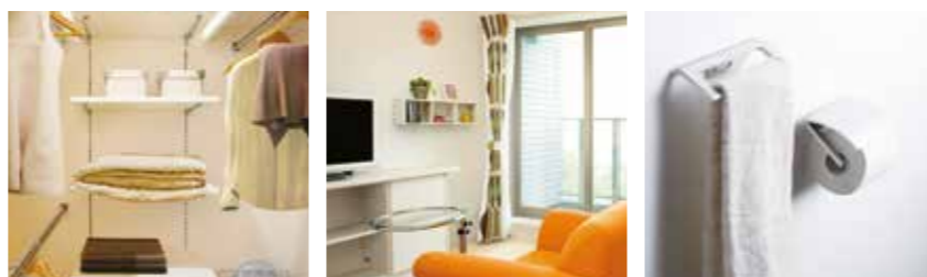
ウォークインクローゼット ディスプレイボックス タオルリング/ペーパーホルダー