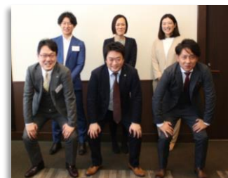
担当する税理士の皆様 ※会員税理士より選出致します。