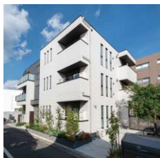
■ T様邸 (3階建) 敷地 106.21坪