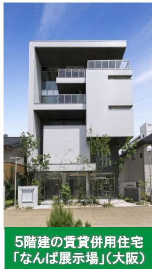
5階建の賃貸併用住宅 「なんば展示場」(大阪)