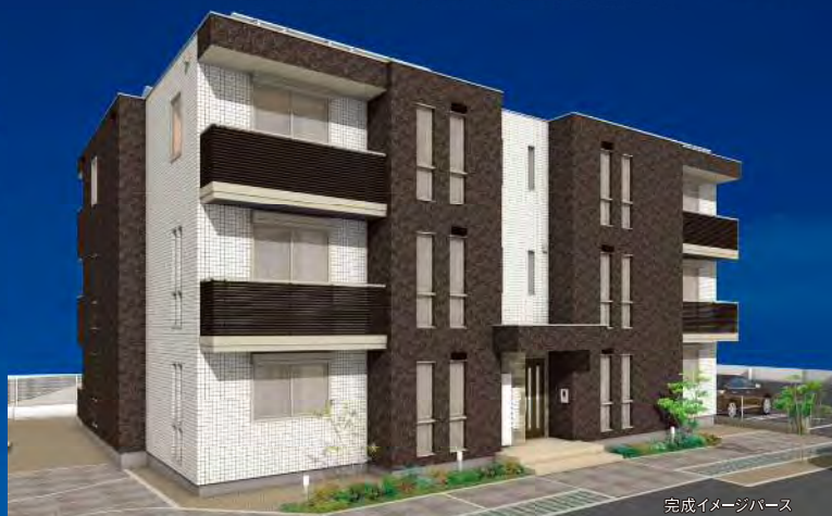
完成イメージパース