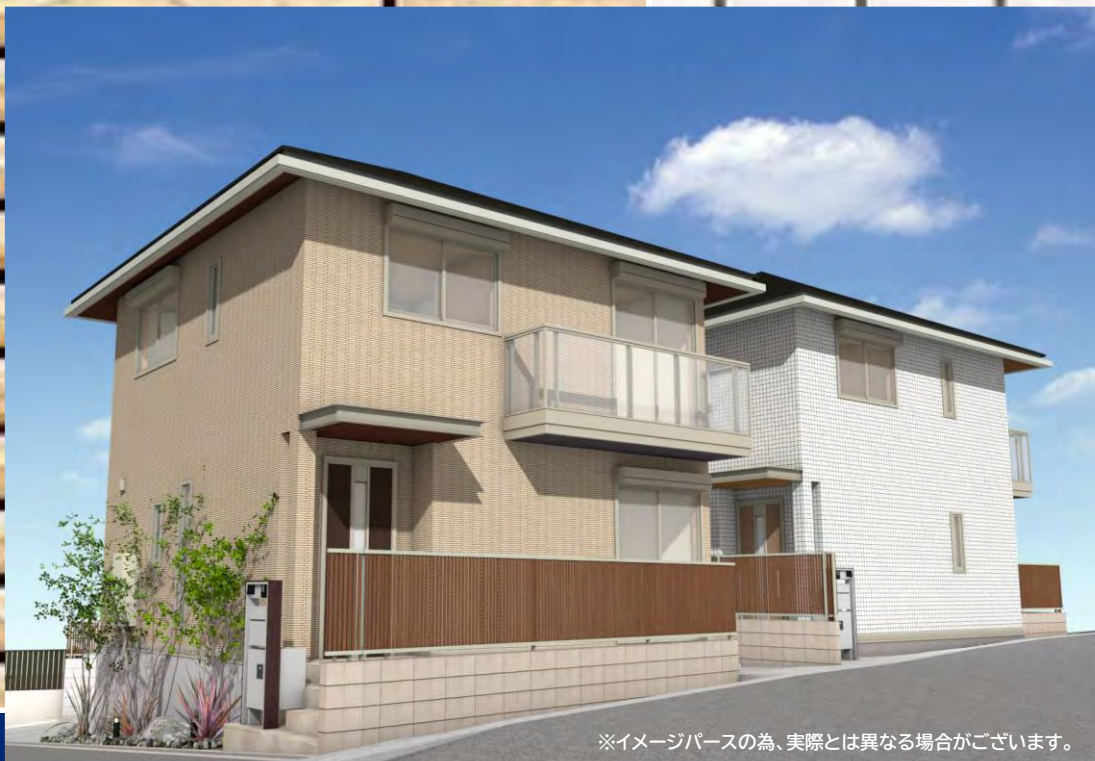
※イメージパースの為、実際とは異なる場合がございます。