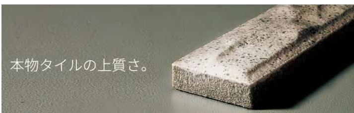
本物タイルの上質さ。

発売から20年・10万棟。多くの実績が、 光触媒のセルフクリーニング効果の確かさを証明。