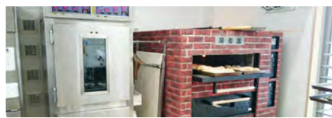
知的障がい者支援施設「愛」

地域の要望を受けてパン屋さんも併設。 大きな窓から中の様子がよくわかる開放的なつくりで、 地域共生を実現しています。