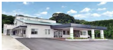
生活介護「セカンドつばさ」 放課後デイ「みらい」の併設拠点

介護や障がい者福祉を一体的に提供する「地域共生社会」の整備において、注目すべき実例をご紹介します。