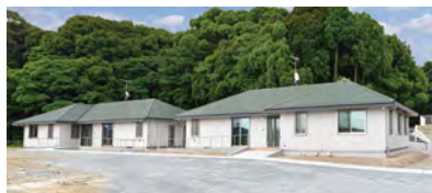
障がい者グループホーム「かわせみ」と「めじろ」