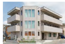
知的障がい者支援施設

当社は、これまで全国で1,900棟超*の高齢者向け施設や医療施設の建築請負実績に加え、高齢者住宅・介護住宅を自社運営してきました。こうした中で得た豊富なノウハウに基づき、「一括借上げケアリンクシステム」のサブリース先である介護運営事業者へ経営モニタリングを行い、安定経営をサポートしています。