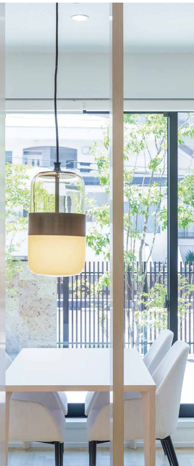
表紙写真：土地活用プラザ宇都宮（栃木県）