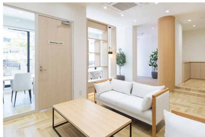
栃木 土地活用プラザ宇都宮 ☎ 0120-058-746 〒320-0813 栃木県宇都宮市 二番町1-25 グランシェイド二番町1階