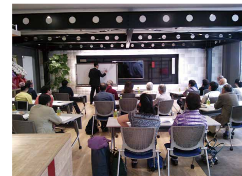
ご参加者の皆さまが熱心に聞き入るセミナー開催時の様子。