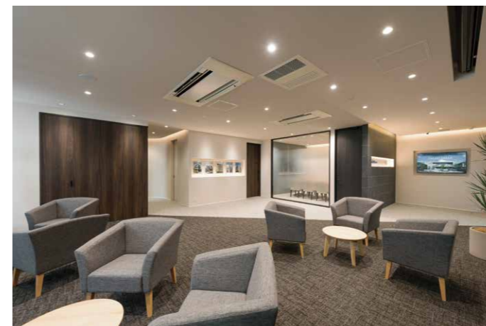
神奈川 ビューノプラザ川崎 ☎ 044-742-8780 〒210-0006 神奈川県川崎市川崎区 砂子2-4-10 ビューリック川崎ビル6階