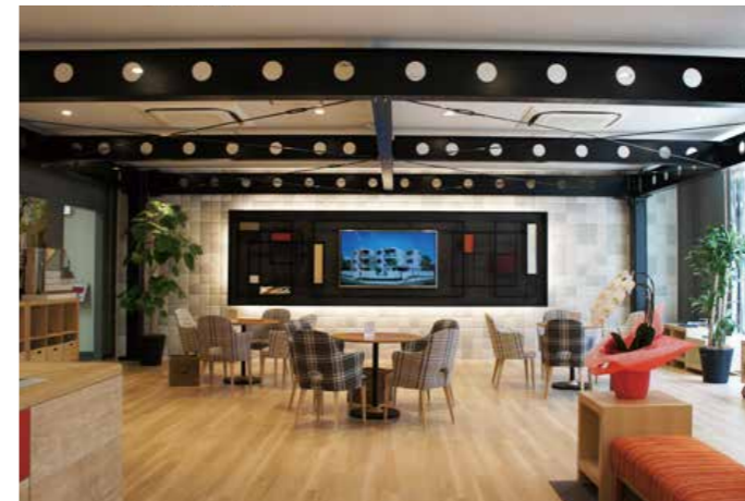
東京 ビューノプラザ大塚 ☎ 03-5979-8797 〒170-0005 東京都豊島区 南大塚3-10-10 いちご南大塚ビル1階