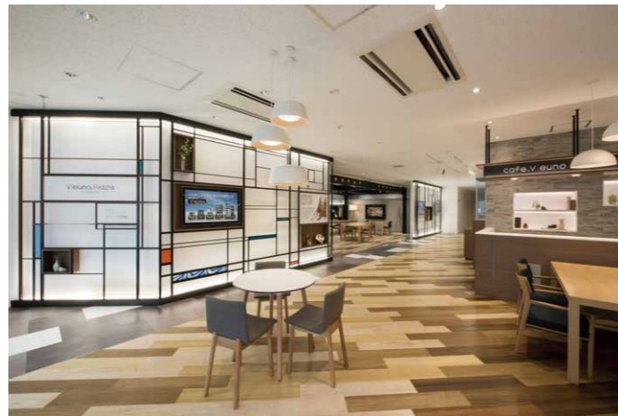
埼玉 ビューノプラザ浦和 ☎ 0120-8746-96 〒330-0063 埼玉県さいたま市浦和区 高砂2-8-3 NTT浦和高砂ビル1階