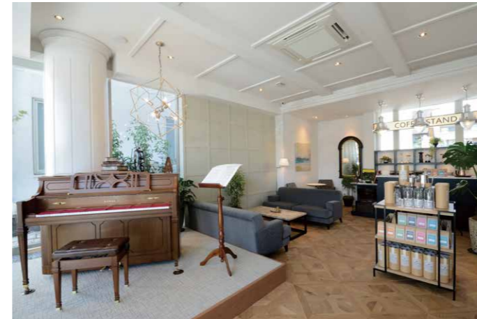
東京 ビューノプラザ駒沢 ☎ 03-5758-1130 〒158-0081 東京都世田谷区 深沢4-26駒沢公園 ハウジングギャラリーステージ3内