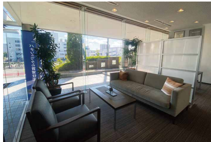
宮城 コンサルティングプラザ仙台 ☎ 022-371-6811 〒981-3133 宮城県仙台市泉区 泉中央2丁目11-9 SKYビル1階(住まいとくらしの情報館内)