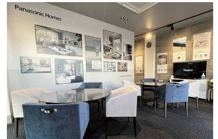
神奈川 コンサルティングプラザ海老名 ☎ 0120-8746-54 〒243-0436 神奈川県海老名市 扇町3-10 ルチア海老名1階