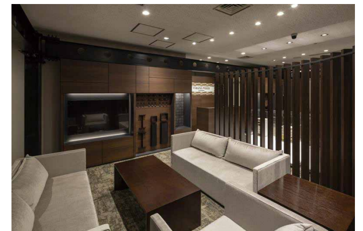
大阪 ビューノプラザ大阪 ☎ 0120-8746-07 〒541-0041 大阪府大阪市中央区 北浜2丁目5-23小寺プラザビル1F