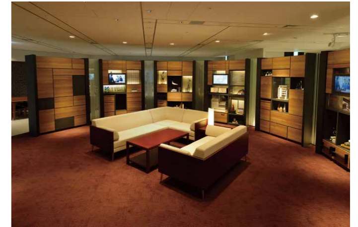
神奈川 ビューノプラザ横浜 ☎ 0120-33-8746 〒220-0012 神奈川県横浜市西区 みなとみらい2丁目2-1 横浜ランドマークタワー33階