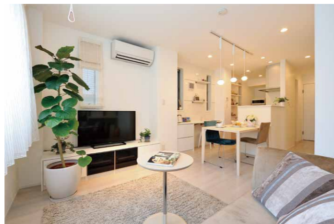
東京 ビューノプラザ浅草 ☎ 03-5833-8746 〒111-0056 東京都台東区 小島2-21-11