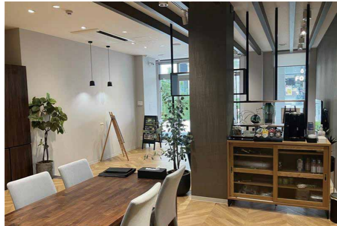
千葉 おたかの森 土地活用相談サロン ☎ 050-3317-0053 〒270-0119 千葉県流山市 おたかの森北1丁目6-8

ご自宅の建て替えに伴う賃貸併用住宅のご計画 や土地資産を活用した新たな収益化のご相談、 ご家族の相続対策、その他 住まいと土地に関す ることならどんなことでもお気軽に。地域に精通 した担当者が各地のサロンでお待ちしています。